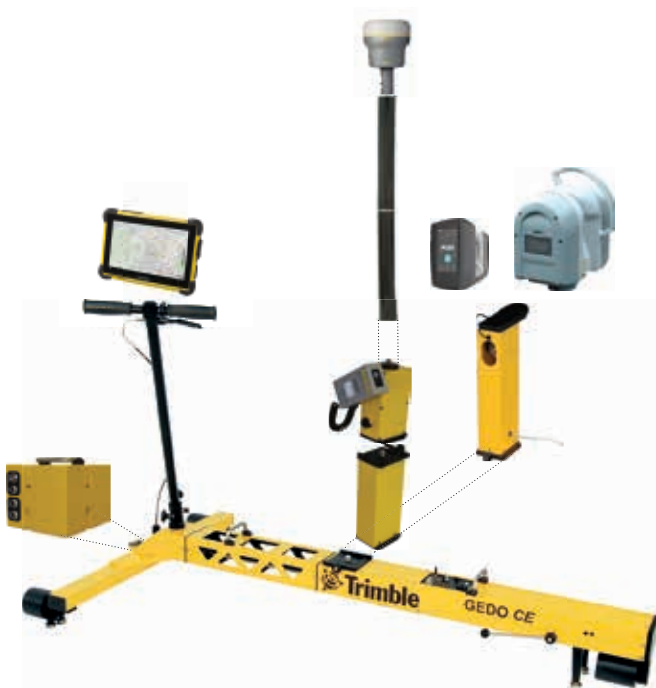
Spezifikationen können jederzeit ohne vorherige Ankündigung geändert werden.

Betriebssystem ..... Microsoft Windows® 7 Professional Display ..... Touchscreen Schnittstellen ..... HDMI, USB 2.0, Bluetooth® 4.0, WiFi (b/g/h) Schutz gegen Umwelteinwirkungen ..... IP65; MIL-STD-810G Temperaturbereich ..... -30 °C bis +60 °C Gewicht ..... 1,4 kg